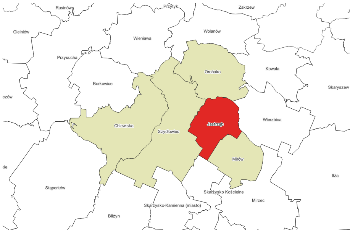
Rysunek 1. Położenie gminy Jastrząb w powiecie sztytowieckim.

Gmina Jastrząb jest gminą miejsko-wiejską, położoną południowej części województwa mazowieckiego, w powiecie sztytowieckim. Sąsiaduje z gminami: Mirów, Orońsko, Skarżysko Kościelne, Szydłowiec i Wierzbica. Powierzchnia gminy wynosi ok. 54,53 km 2 , co stanowi 12,1% powierzchni powiatu. W 2024 r. liczba ludności wynosiła 5 125 osób (dane na 31.12.2024 r.). Przez obszar gminy przepływają rzeki Szabasówka i Śmiałówka. Przez gminę przebiega droga ekspresowa S7, drogi wojewódzkie nr 727 i 735 oraz linia kolejowa relacji Warszawa - Kraków.