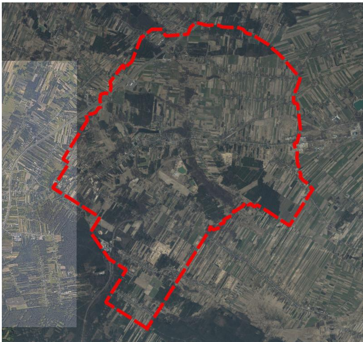
Rysunek 3 Obszar objęty ustaleniami planu ogólnego zaznaczony na ortofotomapie.

Rzeźba terenu na obszarze gminy Jastrzęb ma elementy morfogenezy przed – i czwartorzędowej. Niezależnie od wyróżnionych jednostek jest to rzeźbą denudacyjną o wyraźnym uzewnętrznieniu struktury geologicznej, charakterystyczna dla mezozoicznych obszarów wyżynnych, objętych lądolodami starszych zlodowaceń. Ostatnie zlodowacenie na tym obszarze związane jest z lądolodem środkowopolskim. Obecność lądolodu na tym obszarze wyznacza silnie zerodowana strefa pagórów czołowo-morenowych oraz zespół krzyżujących się rynien i lokalnych pradolin. Formy te, o wyraźnie erozyjnych założeniach rozbitą obszar zasypania lodowcowego na wyspy o różnej wielkości, przyczyniając się do częściowego odsłonięcia starszego podłoża. Najniższe wysokości bezwzględne występują w północnej części gminy w dolinie rzeki Szabasówki - 176 m n.p.m. Najwyższym punktem jest wzgórze położone na północ od wsi Gąsawy Rządowe – 247,1 m n.p.m. Takie ukształtowanie związane jest z położeniem gminy w obszarze przejściowym między nizinami a pasmem wyżyn.